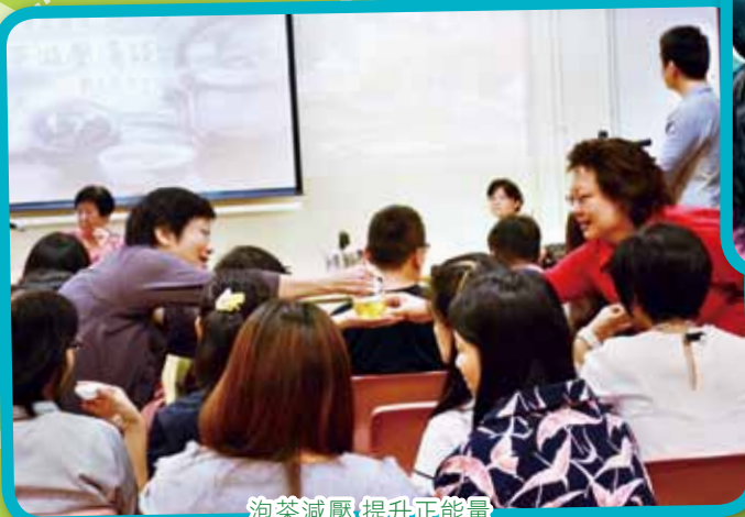
泡茶減壓 提升正能量