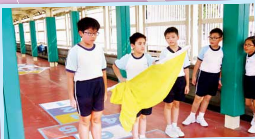
用心訓練，積極投入

每逢旗下講話之前，大家都會看到雄赳赳的升旗隊隊員，精神奕奕地昂首進場，把國旗徐徐升起。其實他們都是受過嚴格訓練，才令使升旗禮暢順地進行，所以，各位同學除了要尊重升旗禮之外，更要欣賞升旗隊隊員及老師的全情投入呢！