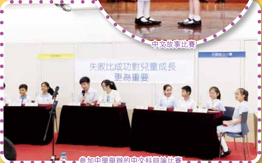
參加中學舉辦的中文科辯論比賽