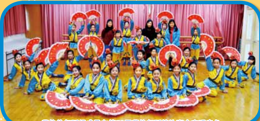
學校的舞蹈組成員在第52屆學校舞蹈節比賽中表現出色