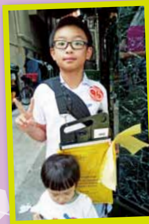
一家大細一同做善事