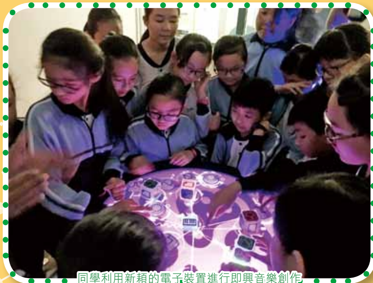
同學利用新穎的電子裝置進行即興音樂創作

在2/12/2015、3/12/2015兩天，本校40位P.5、P.6的視藝室服務生到中環的元創坊，參觀了「創意匯聚十日棚」展覽，這個展覽雲集了本地和海外多位藝術家，展出多項不同的創意藝術作品，作風前衛，新穎有趣。視藝室服務生能參觀是次展覽，機會難得。