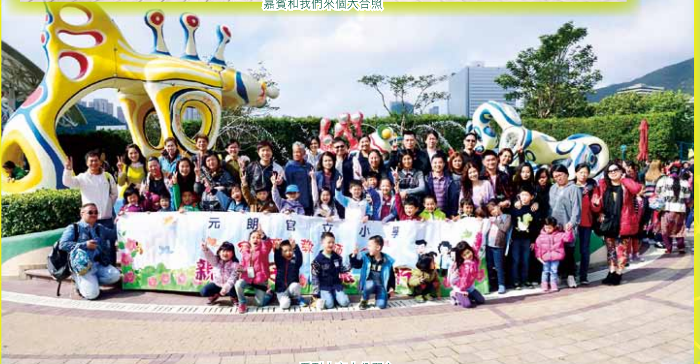
看到大家十分開心