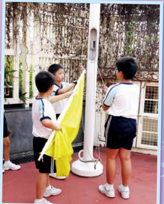
隊員們努力練習升旗