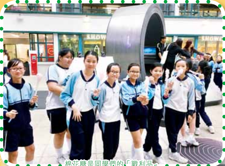
棉花糖是同學們的「戰利品」

在2/12/2015、3/12/2015兩天，本校40位P.5、P.6的視藝室服務生到中環的元創坊，參觀了「創意匯聚十日棚」展覽，這個展覽雲集了本地和海外多位藝術家，展出多項不同的創意藝術作品，作風前衛，新穎有趣。視藝室服務生能參觀是次展覽，機會難得。