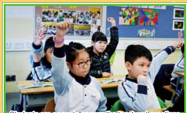
Students are eager to answer the teachers' questions