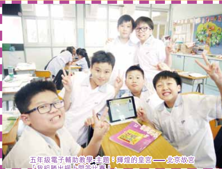
五年級電子輔助教學主題：輝煌的皇宮——北京故宮 「我組勝出網上問答比賽！」

本學期中文科採用多元化教學設計，利用電子學習工具來促進學生學習。 學生利用語音辨識系統，合作學習，齊齊創作劇本。