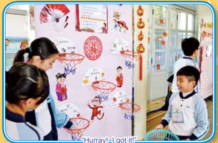
"Hurray! I got it!"