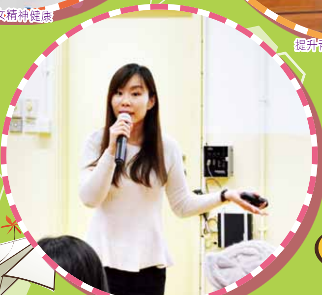
提升子女學習能力