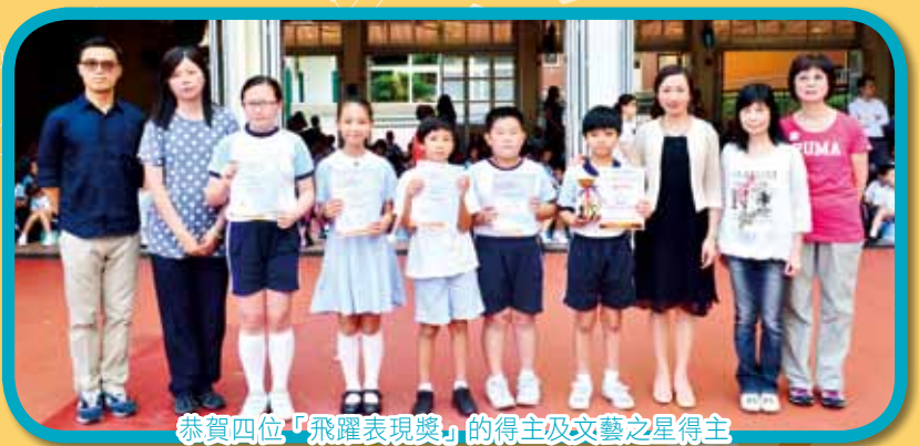
恭賀四位「飛躍表現獎」的得主及文藝之星得主