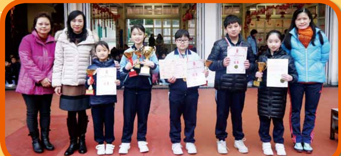
我們在「狀元盃第四屆全港兒童普通話朗誦比賽」及第七屆「中華挑戰盃」全港人才藝術朗誦大賽獲獎啦！