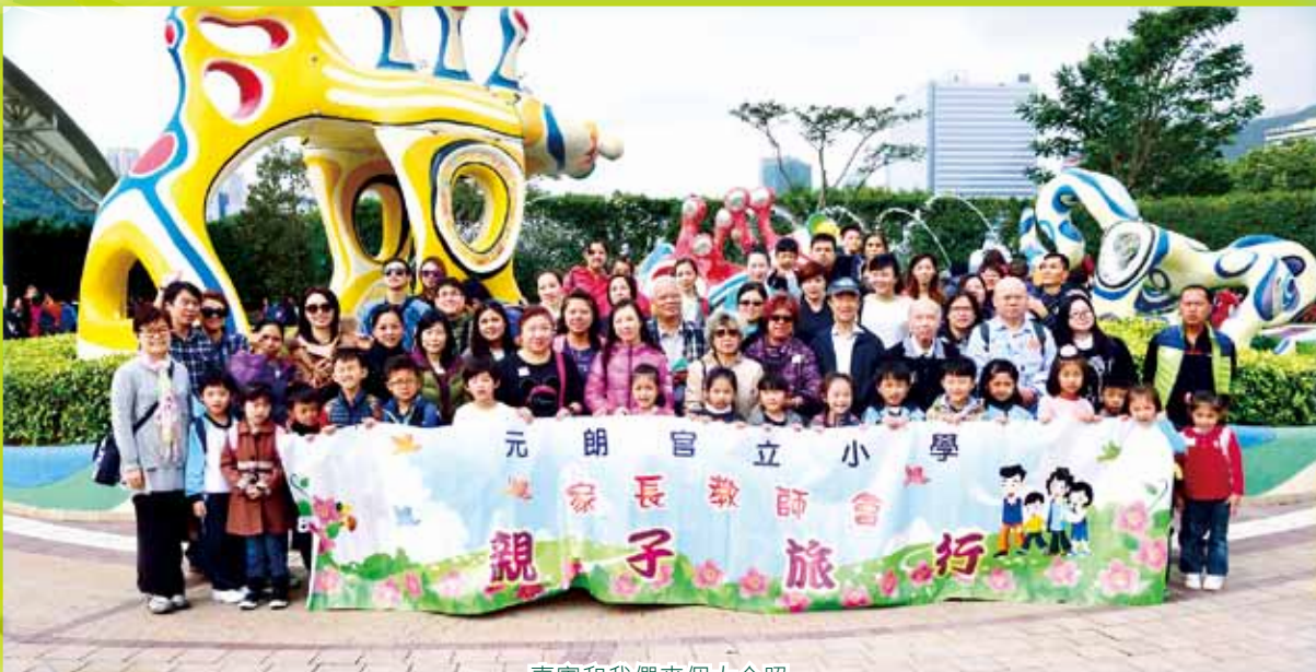
嘉賓和我們來個大合照