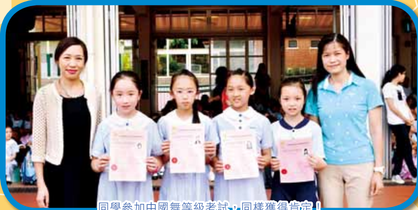
同學參加中國舞等級考試，同樣獲得肯定!