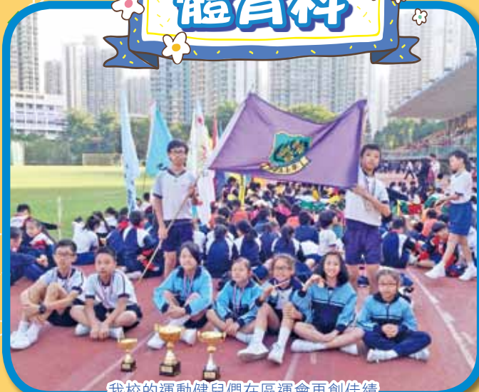
我校的運動健兒們在區運會再創佳績