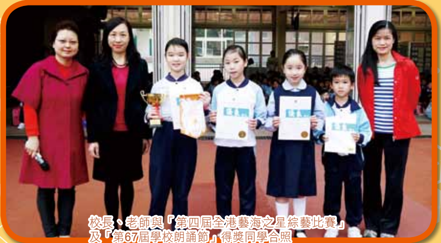
校長、老師與「第四屆全港藝海之星綜藝比賽」及「第67屆學校朗誦節」得獎同學合照