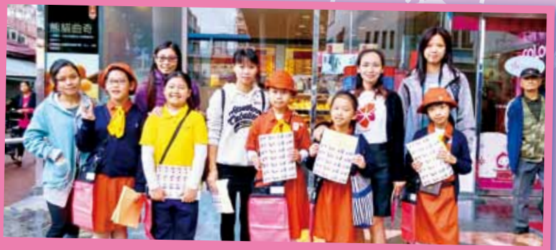
小女童軍積極參加親子賣旗活動

本校小女童軍的集會活動包括編織毛冷圍巾、製作芒果糯米糍、手工藝、步操訓練、遊戲等。小女童軍熱心服務，發揮幫助別人的精神，於本年度曾參與售賣獎券及親子賣旗活動。