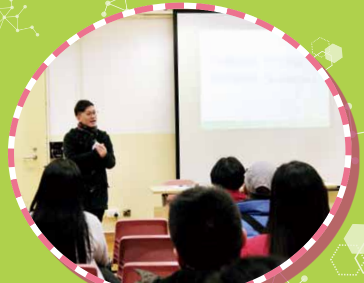
言語治療工作坊-提升子女的溝通能力