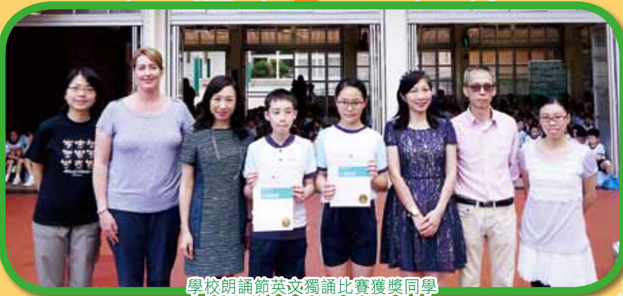
學校朗誦節英文獨誦比賽獲獎同學