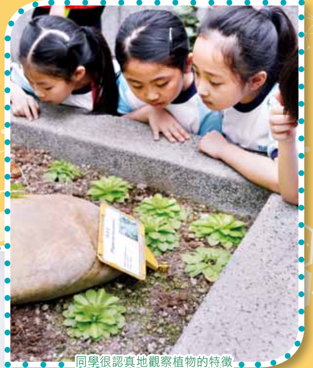
同學很認真地觀察植物的特徵