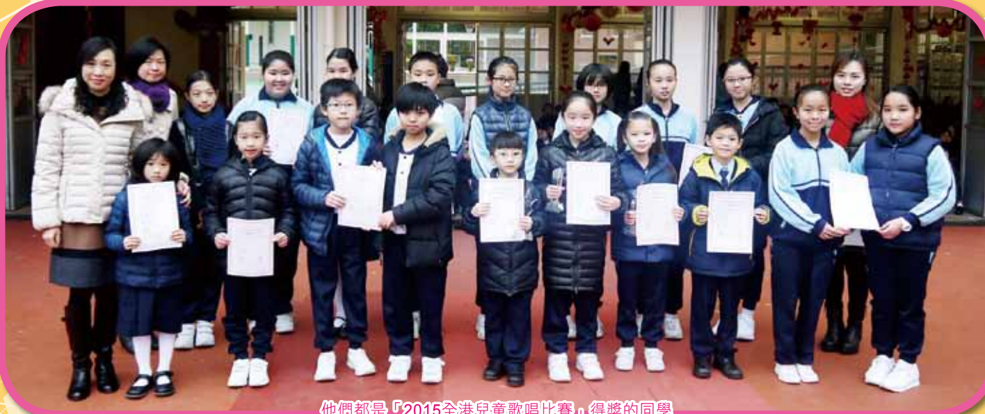
他們都是「2015全港兒童歌唱比賽」得獎的同學