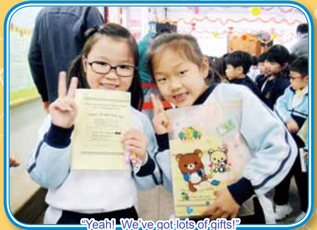
"Yeah! We've got lots of gifts!"

English Day was held on 18th January, 2016 for students to arouse their interest in learning English through language games, share the fun of Chinese New Year and build up their confidence in using English through fun English activities such as saying the tongue twisters, playing fishing game, singing songs and engaging in fun vocabulary games. Students had great fun on that day.