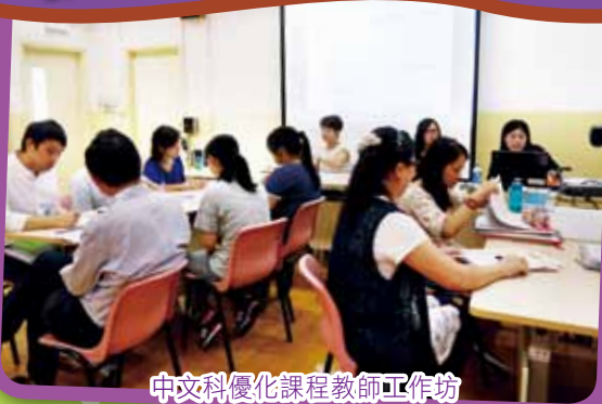
中文科優化課程教師工作坊