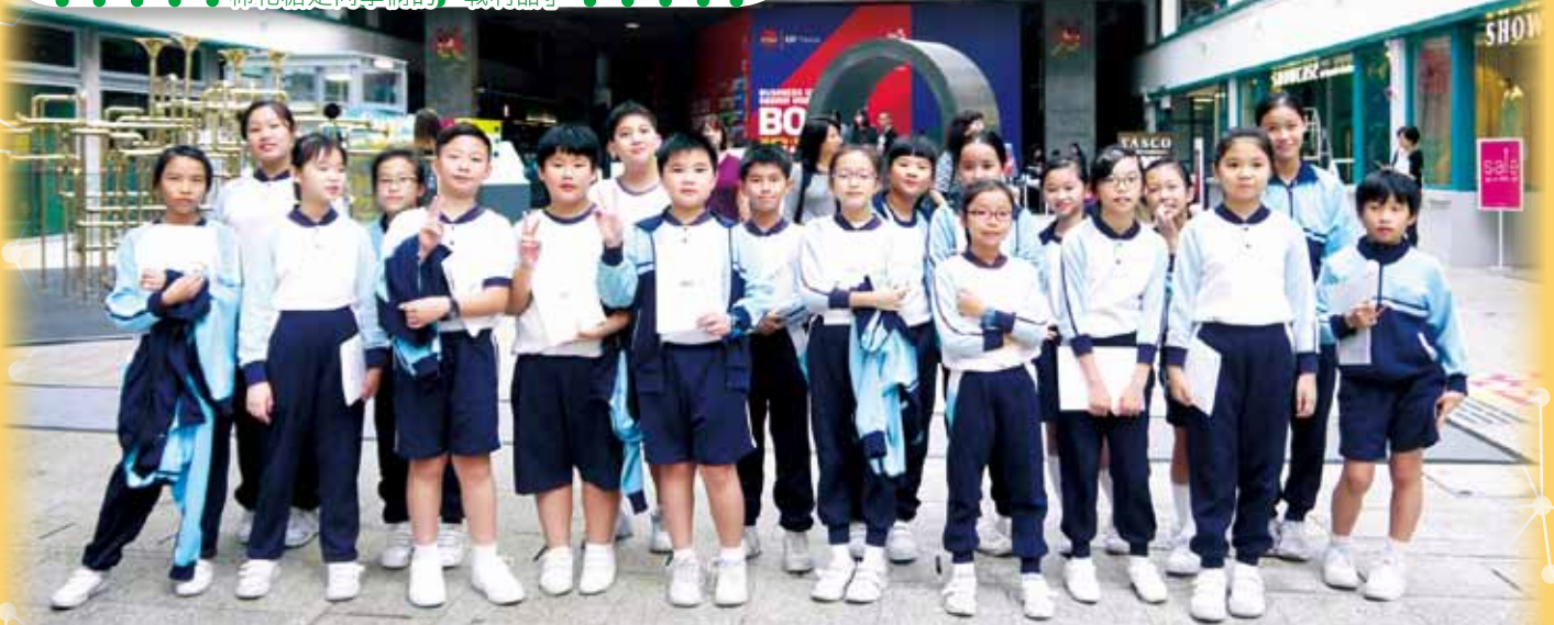
視藝室服務生參觀deTour2015大合照