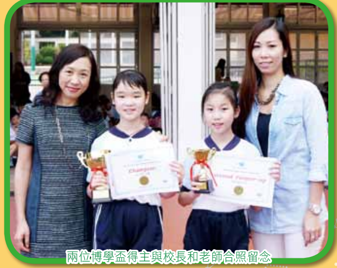
兩位博學盃得主與校長和老師合照留念