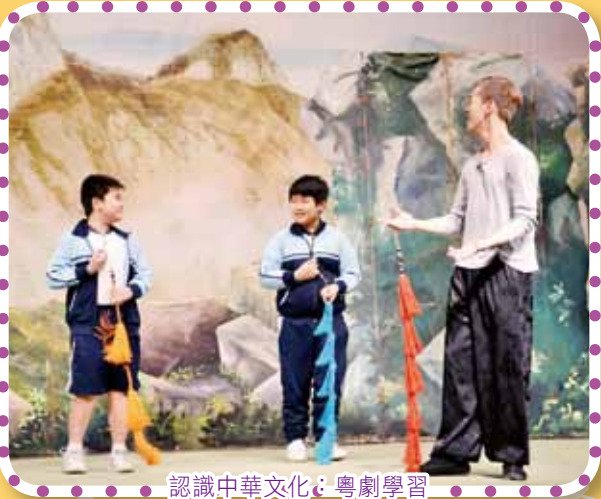
認識中華文化：粵劇學習