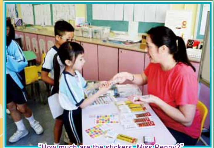
"How much are the stickers, Miss Penny?"