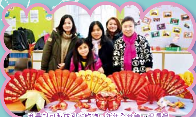
利是封可製成孔雀飾物、新年全盒等，很環保