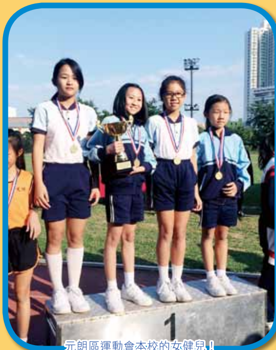
元朗區運動會本校的女健兒!