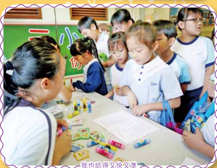
我也唸得又快又準