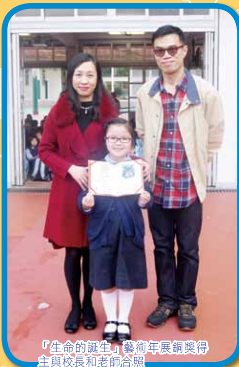
「生命的誕生」藝術年展銅獎得主與校長和老師合照