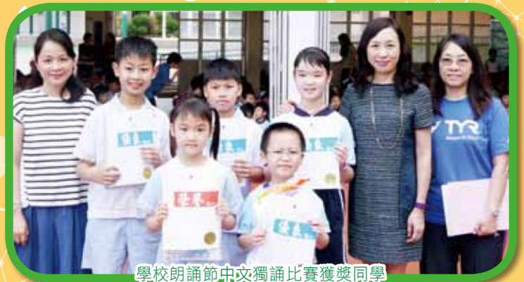
學校朗誦節中文獨誦比賽獲獎同學