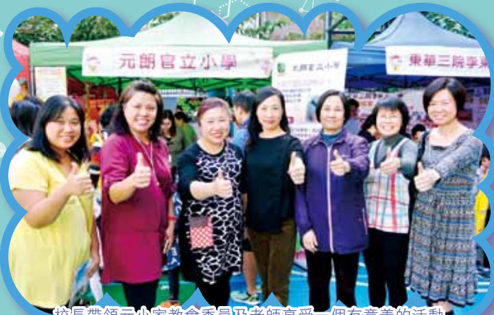
校長帶領元小家教會委員及老師享受一個有意義的活動

本校參加了由元朗優質教育嘉年華2015暨「升小睇真D」活動。當天有二十多間學校參與攤位活動。各家長委員及義工負責攤位佈置及主持攤位活動，十分落力，氣氛熱鬧。本校學生參與直笛演出，十分精彩。