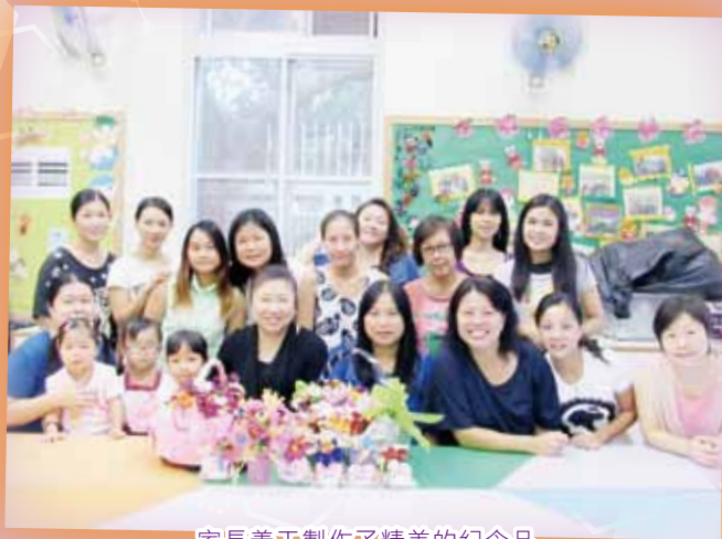
家長義工製作了精美的紀念品