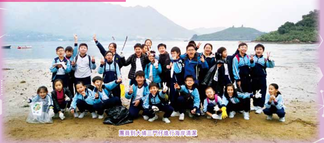
團員到大埔三門仔進行海岸清潔