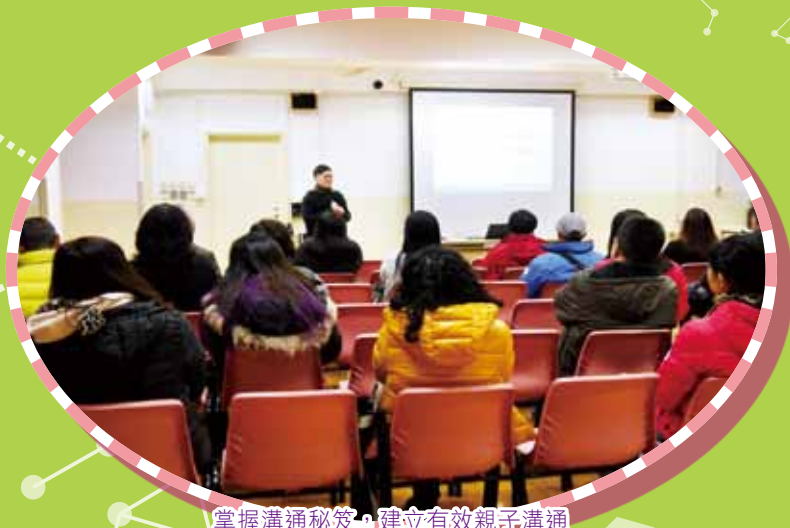
掌握溝通秘笈，建立有效親子溝通