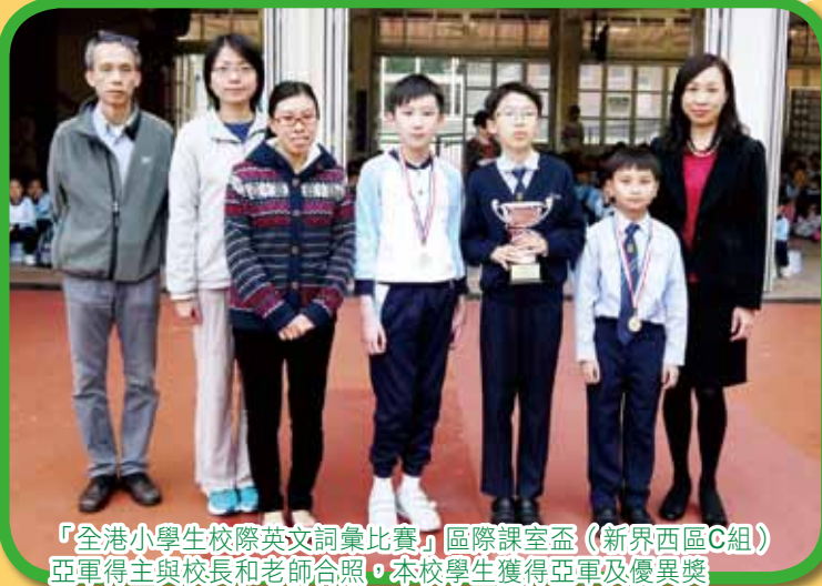
「全港小學生校際英文詞彙比賽」區際課室盃（新界西區C組）亞軍得主與校長和老師合照，本校學生獲得亞軍及優異獎