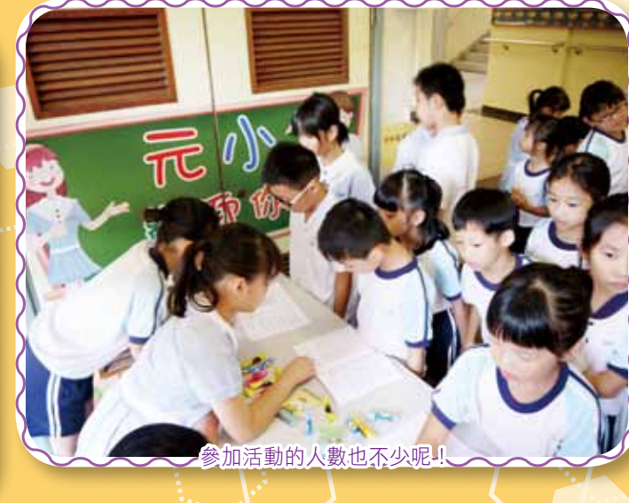
參加活動的人數也不少呢!