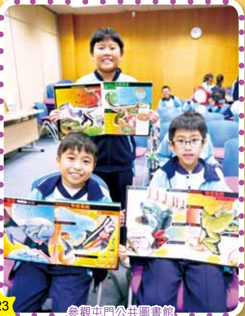
參觀屯門公共圖書館