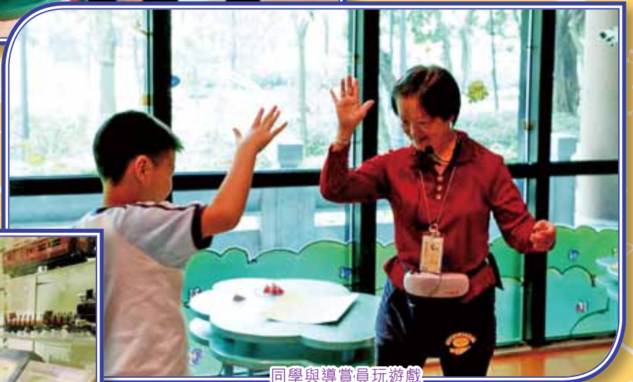
同學與導賞員玩遊戲