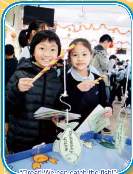
"Great! We can catch the fish!"