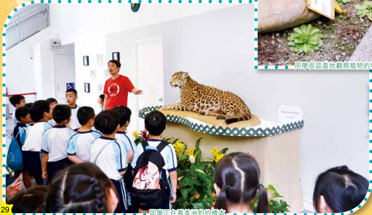
同學正在看美洲豹的標本