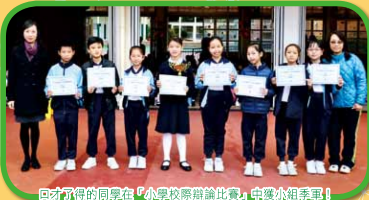
回才了得的同學在「小學校際辯論比賽」中獲小組季軍!