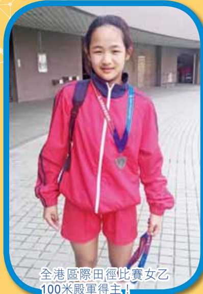
全港區際田徑比賽女乙 100米殿軍得主!