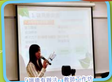
「調適有辦法」教師工作坊