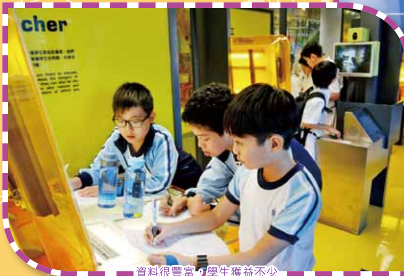
資料很豐富，學生獲益不少