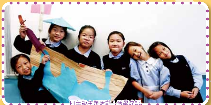
四年級主題活動：活學成語