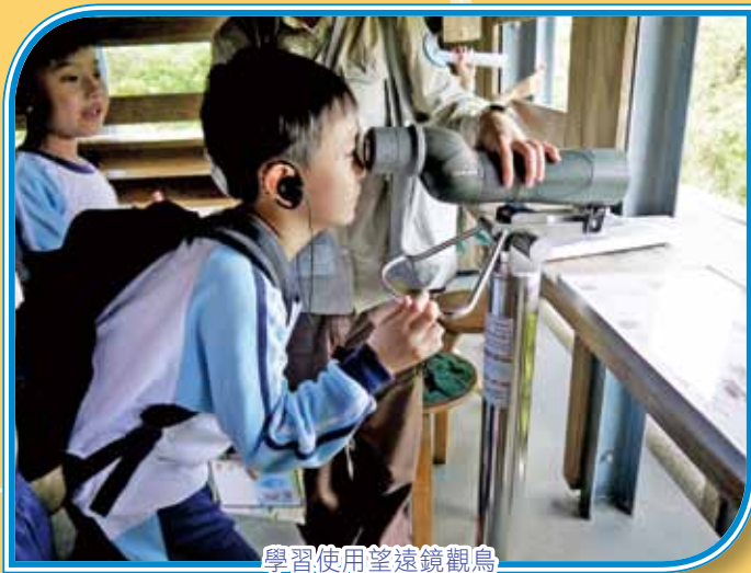
學習使用望遠鏡觀鳥