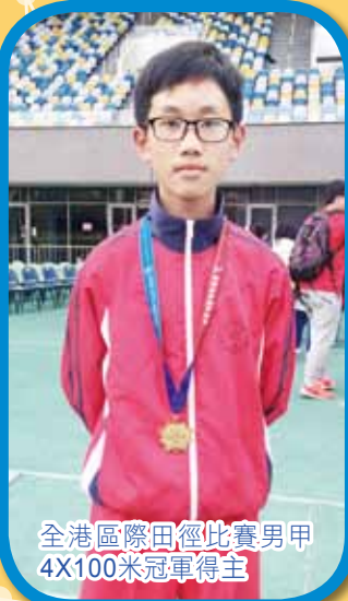
全港區際田徑比賽男甲 4X100米冠軍得主