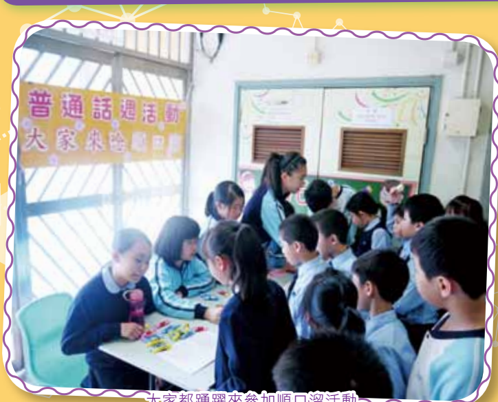
大家都踴躍來參加順口溜活動

普通話科在上下學期舉辦了兩次普通話周。透過不同形式的普通話活動，圍繞着本年度學校所訂下的學習目標：「勤學自學愉快學、愛己愛人愛社群」，藉此機會提高學生聽說普通話的能力，同時也希望引起學生對普通話的興趣。為了提高學生聽說普通話的能力，老師鼓勵學生在日常生活中多運用普通話，星期一至星期三。午膳時段，設立普通話歌曲點播站。普通話小主持人在普通話歌曲點播站節目中先朗讀同學的點播祝福，再播放精選普通話歌曲。透過此活動，讓全校學生都可以透過中央廣播，表達學生之間的互相祝福，促進校內的關愛文化；除此之外，星期四至星期五午膳時段，老師播放普通話校園電視節目，藉此機會讓學生多聽多看普通話節目。同時，為了讓學生多練習普通話，在10月份和3月份，本科在小息的時候舉行了由普通話大使主持的「大家來唸繞口令」及「大家來唸順口溜」活動，透過唸繞口令，可以訓練學生口齒伶俐，說話清晰。順口溜也是民間流行的一種口頭韻文，透過此活動，可訓練學生的口語詞彙，順口地唸出句子，學生們都積極參與，效果理想。