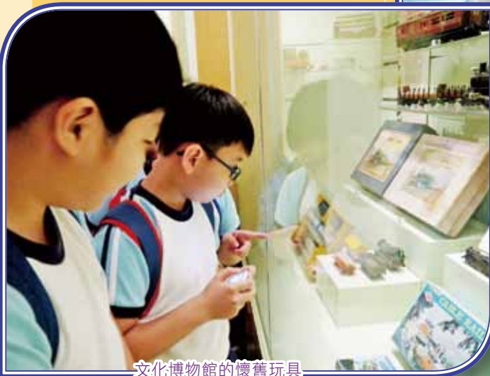
文化博物館的懷舊玩具