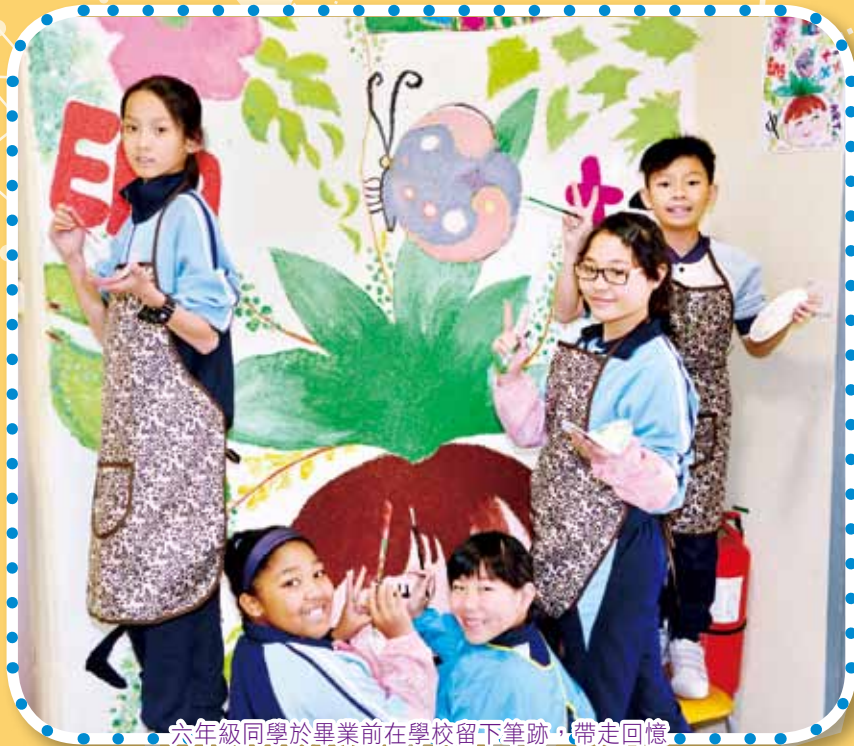
六年級同學於畢業前在學校留下筆跡，帶走回憶。