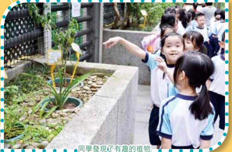
同學發現了有趣的植物

常識科透過全方位學習來發展學生的各種能力和提昇學生的學習興趣。專題研習和實地研習更為學生提供探究及親身實踐的學習經歷。