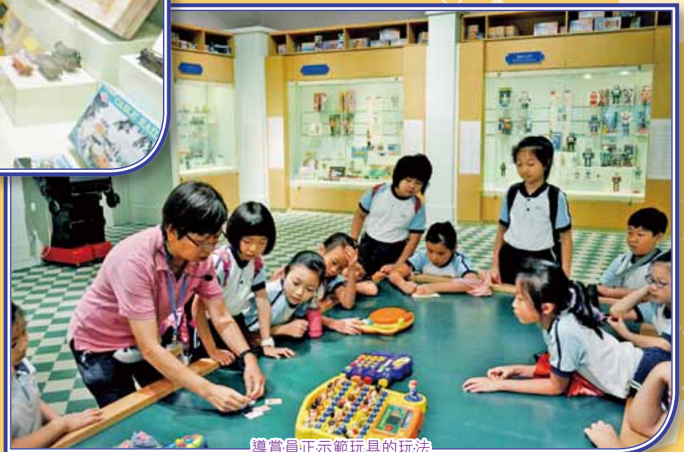
導賞員正示範玩具的玩法