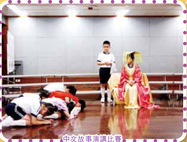
中文故事演講比賽