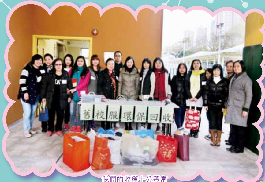
我們的收穫十分豐富

為加強學生環保意識及發揚關愛精神，本校於19/1及20/1-2016舉行「環保校服回收」活動，家長將舊校服交回學校，學校安排校服及體育服送贈給有需要的同學。是次活動反應熱烈，獲得「環保校服」的學生約60多人，感謝家長及同學的積極回應及踴躍參與，共同發揚關愛精神，真正實踐了環保教育！