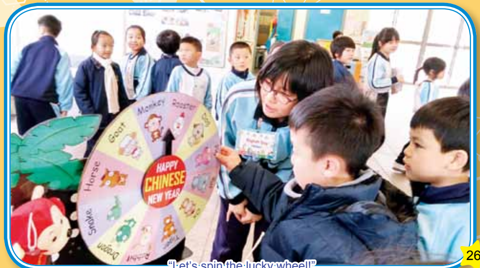
"Let's spin the lucky wheel!"