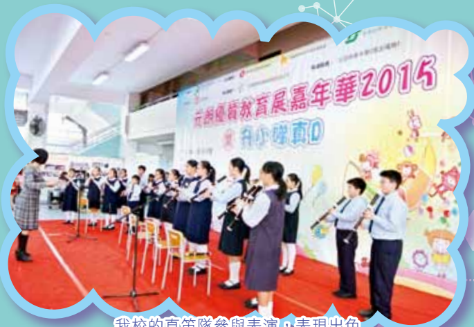
我們的直笛隊參與表演，表現出色