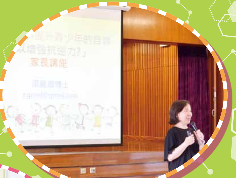
提升青少年的自尊感以增強抗逆力