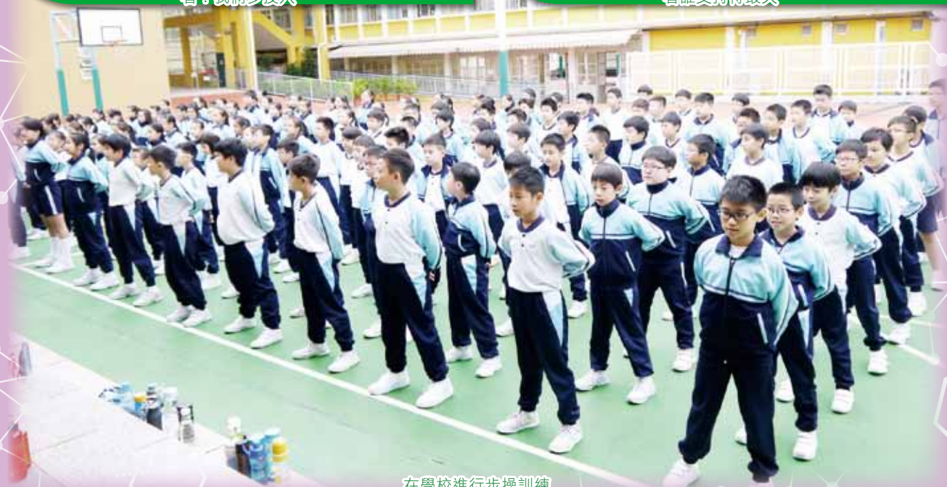
在學校進行步操訓練