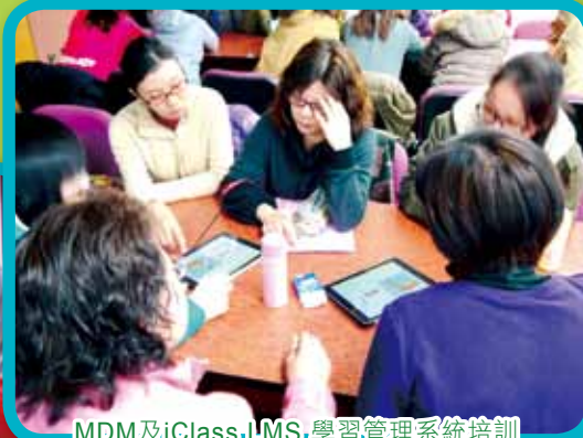
MDM及iClass LMS 學習管理系統培訓