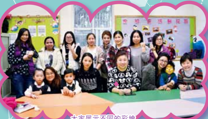
大家展示不同的彩繪

為了讓學生增廣見聞，加強親子關係，以及增加家長與教師的聯繫，本校於2015年12月舉辦了親子旅遊活動。當天，約四百多名嘉賓、老師、家長及學生一起遊覽海洋公園，享受一個有意義的活動，家長更與子女享受了一整天的親子樂。