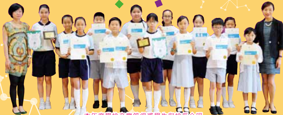
本年度學校音樂節得獎學生與校長合照