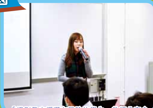
「識別及支援潛在風險的學生」教師分享會