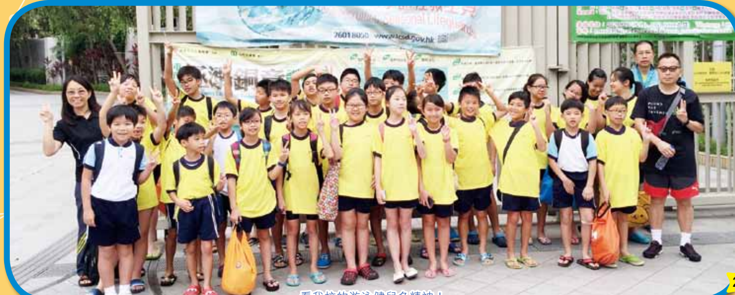
看我校的游泳健兒多精神!