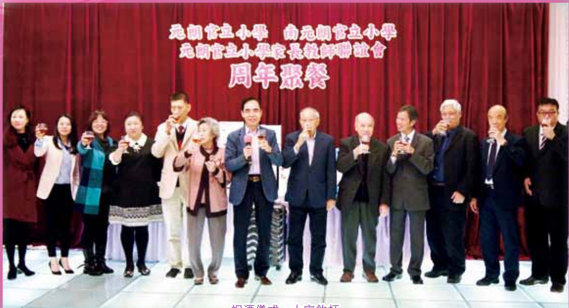
祝酒儀式，大家飲杯