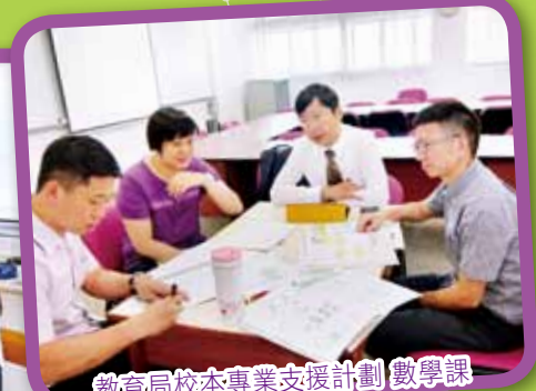
教育局校本專業支援計劃 數學課