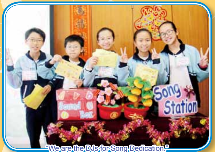
"We are the DJs for Song Dedication."