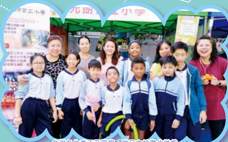
多謝各位義工及同學，當日主持攤位遊戲