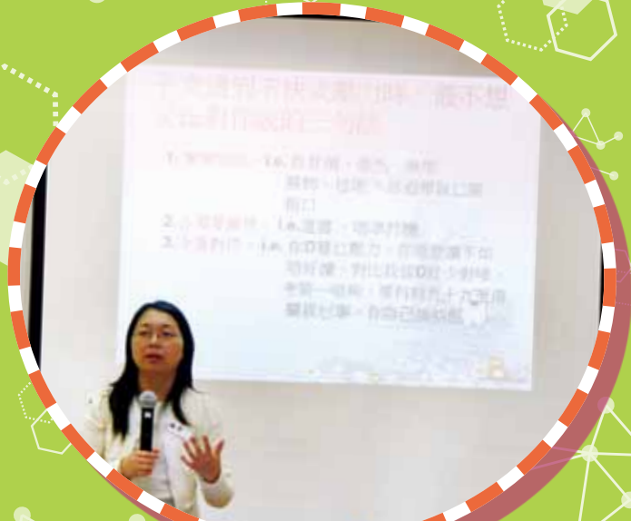
提高子女精神健康